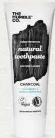
משחת שיניים טבעית בתוספת פחם