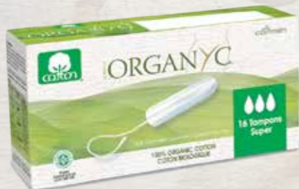
סופר 16 יח' באריזה