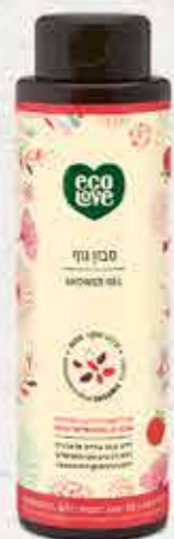
סבון גוף 500 מ"ל