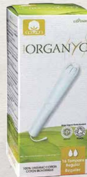
רגולר 16 יח' באריזה