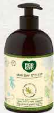
סבון ידיים 500 מ"ל