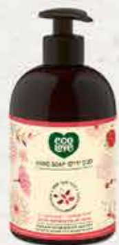
סבון ידיים 500 מ"ל