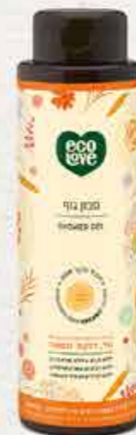
סבון גוף 500 מ"ל