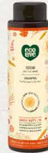
שמפו 500 מ"ל