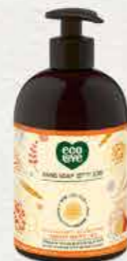
סבון ידיים 500 מ"ל