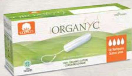
סופר פלוס 16 יח' באריזה