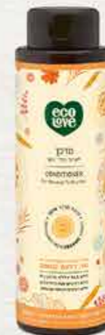
מרכך 500 מ"ל