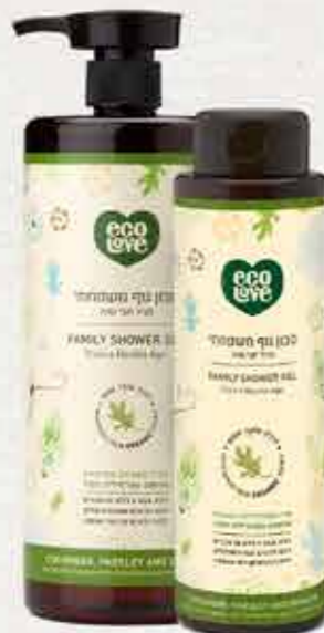
סבון גוף 500 מ"ל | 1 ליטר