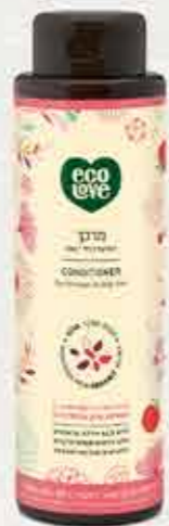
מרכך 500 מ"ל