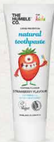
משחת שיניים טבעית לילדים