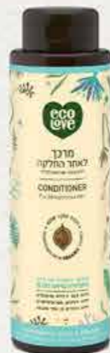
מרכך 500 מ"ל