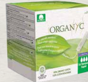
סופר 16 יח' באריזה