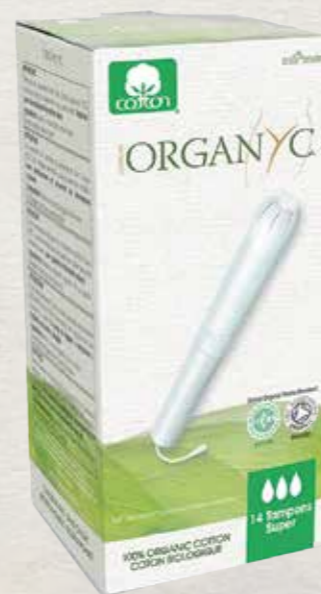
סופר 16 יח' באריזה