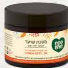
מסיכת שיער 350 מ"ל