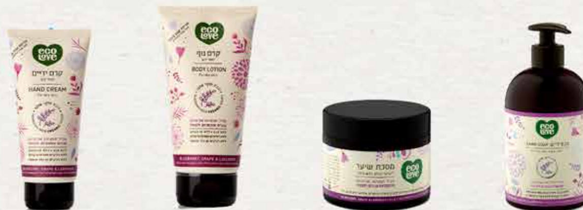
קרם ידיים 100 מ"ל