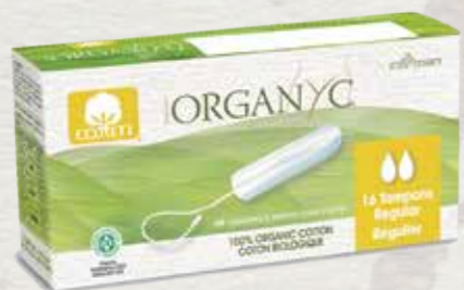
רגולר 16 יח' באריזה