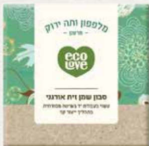
סבון שמן זית אורגני מלפפון ותה ירוק