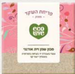
סבון שמן זית אורגני פריחת השקד