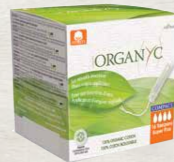
סופר+ 16 יח' באריזה

טמפונים קומפקטיים 100% כותנה אורגנית עם מוליך ביו פלסטיק ממקור טבעי ומתחדש. מוליך הטמפון קומפקטי, רך ומעוגל להחדרה נוחה.