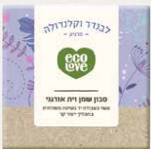
סבון שמן זית אורגני לבנדר וקלנדולה