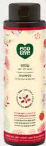
שמפו 500 מ"ל