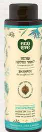
שמפו 500 מ"ל