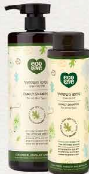
שמפו 500 מ"ל | 1 ליטר