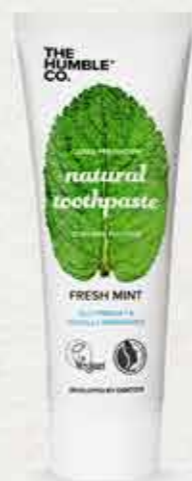
משחת שיניים טבעית בטעם מנטה