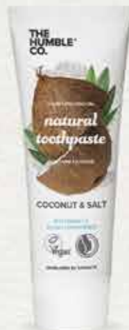
משחת שיניים טבעית בטעם קוקוס ומלח