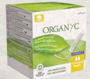
רגולר 16 יח' באריזה