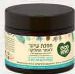
מסיכת שיער 350 מ"ל