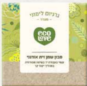
סבון שמן זית אורגני גרניום לימוני