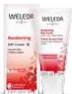
קרם יום רימונים