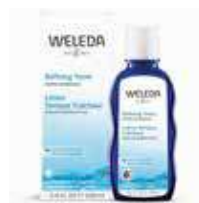
מי פנים לניקוי ואיזון