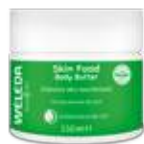
סקין פוד חמאת גוף