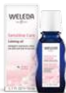
שמן שקדים לפנים