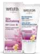
קרם יום נר הלילה