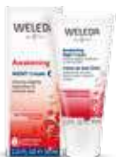
קרם לילה רימונים