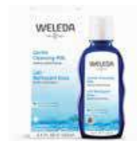
חלב פנים לניקוי ואיזון